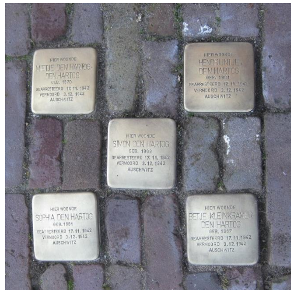
Na het schoonmaken